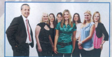
Ihr Team der Steuerberatungsgesellschaft KWT - Kislinger & Partner