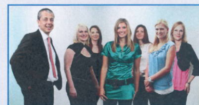
Ihr Team der Steuerberatungsgesellschaft KWT - Kislinger & Partner