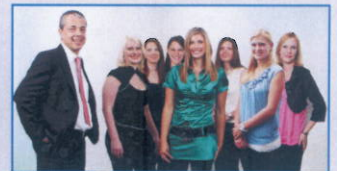
Ihr Team der Steuerberatungsgesellschaft KWT - Kislinger & Partner